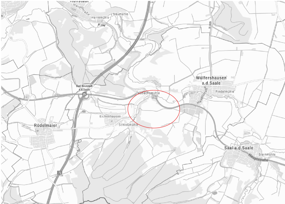
Abb. Übersicht Lage des Vorhabens ohne Maßstab

(Landkreis Rhön-Grabfeld, Regierungsbezirk Unterfranken). Er befindet sich südwestlich von Wülfershausen auf einem flachen Talhang zur Fränkischen Saale.