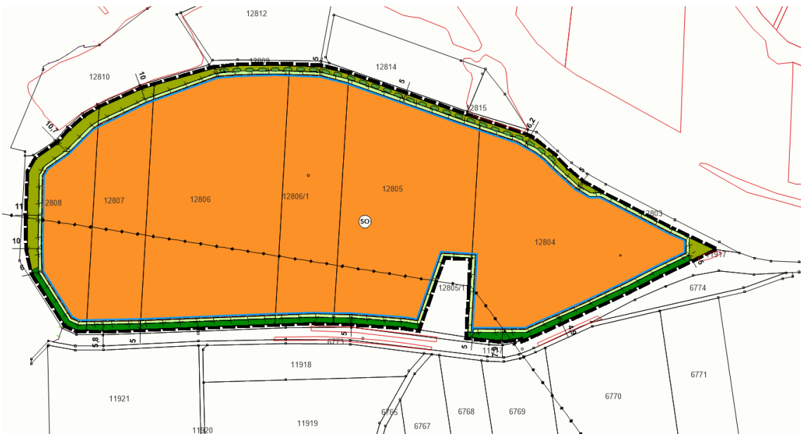
Abb. Darstellung des Vorhabens (ohne Maßstab)

VR-Bank Main-Rhön eG IBAN: DE74 7906 9165 0005 7164 46 BIC: GENODEF1MLV